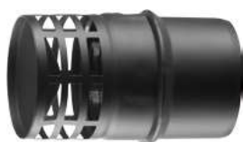
GRIGLIA SCARICO ORIZZONTALE HORIZONTAL EXHAUST GUARD