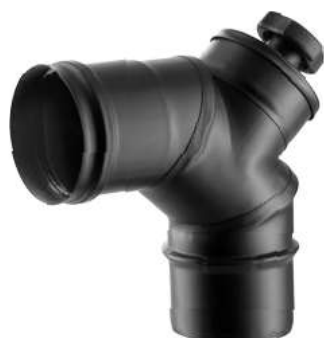
CURVA A 90° CON ISPEZIONE 90° BEND W/ INSPECTION DOOR