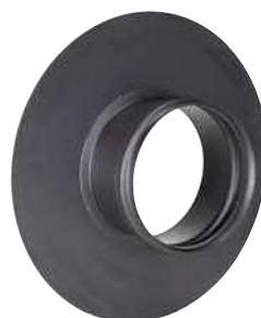
ROSONE A MURO PASSANTE CROSSING ROSETTE FOR WALL