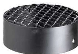
GRIGLIA ASPIRAZIONE NERA AIR INTAKE GUARD, BLACK