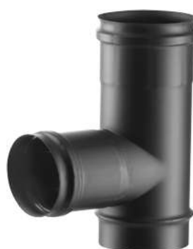
RACCORDO A T 90° STACCO RIDOTTO 80 FEMMINA 90° TEE PIECE, FEMALE BRANCH REDUCED TO 80