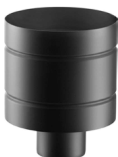
TERMINALE ANTIVENTO WINDPROOF CAP