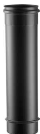
ELEMENTO LINEARE H=1000 LINEAR ELEMENT H=1000