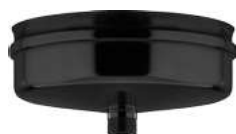
TAPPO CON SCARICO CAP WITH DRAIN