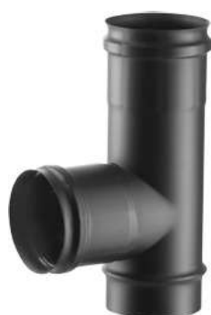
RACCORDO A T 90° STACCO FEMMINA 90° TEE PIECE, FEMALE BRANCH