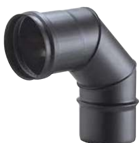
CURVA A 90° 90° BEND