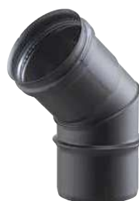
CURVA A 45° 45° BEND