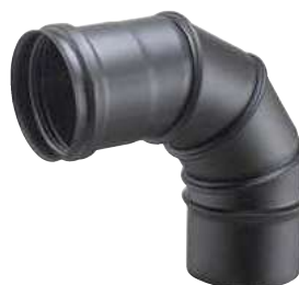
CURVA GIREVOLE REGOLABILE 0-90° 0-90° ADJUSTABLE BEND