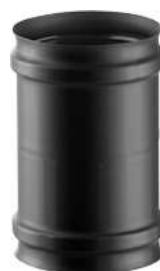
MANICOTTO FEMMINA/FEMMINA FEMALE/FEMALE SLEEVE