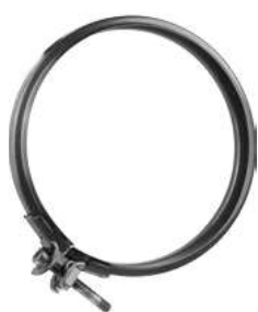
FASCETTA DI GIUNZIONE JOINT BAND