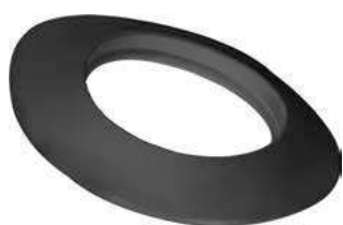
ROSONE IN SILICONE SILICONE ROSETTE