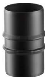
MANICOTTO MASCHIO/MASCHIO MALE/MALE SLEEVE