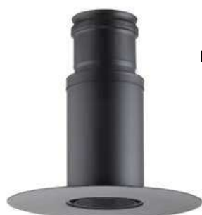
ROSONE UNICO PER SOLAIO/PARETE UNIQUE ROSETTE FOR ROOF/WALL