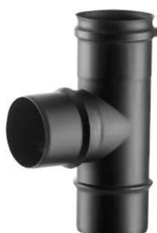
RACCORDO A T 90° STACCO MASCHIO 90° TEE PIECE, MALE BRANCH