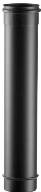
ELEMENTO LINEARE H=2000 LINEAR ELEMENT H=2000