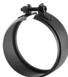
FASCETTA COPRIGIUNTO JOINT CLAMP BAND