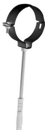
COLLARE CON TASSELLO PIPE CLAMP W/ WALL PLUG