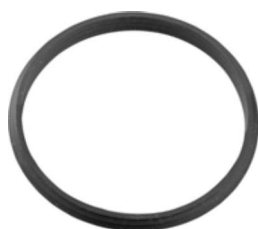
ORING DI TENUTA O-RING SEAL